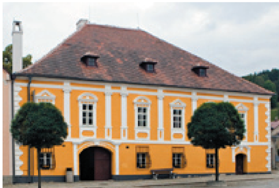
Rodný dům Josefa Hoffmanna v Brtnici

Rodný dům Josefa Hoffmanna představuje ukázkou designu tohoto předního představitele vídeňské secese přímo v jeho rodišti. Jedná se o barokní stavbu, kterou v roce 1907 upravil pro svou rodinu. Zaměřil se na interiér, navrhl pestrou ornamentální výmalbu stěn jednotlivých pokojů a nábytek po rodičích doplnil novými kusy v duchu vídeňské moderny.